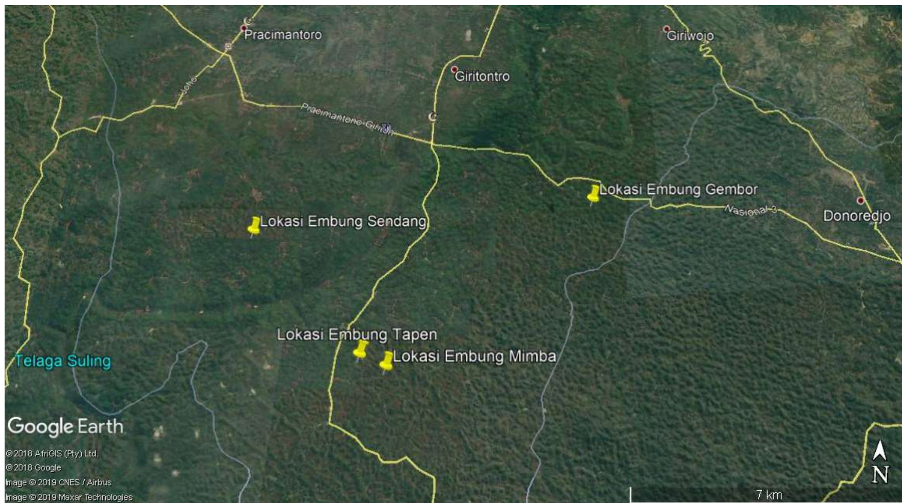
Gambar 1 Peta Lokasi Pekerjaan Emb. Mimba, Emb. Tapen, Emb. Gembor, Emb. Sendang di Kabupaten Wonogiri