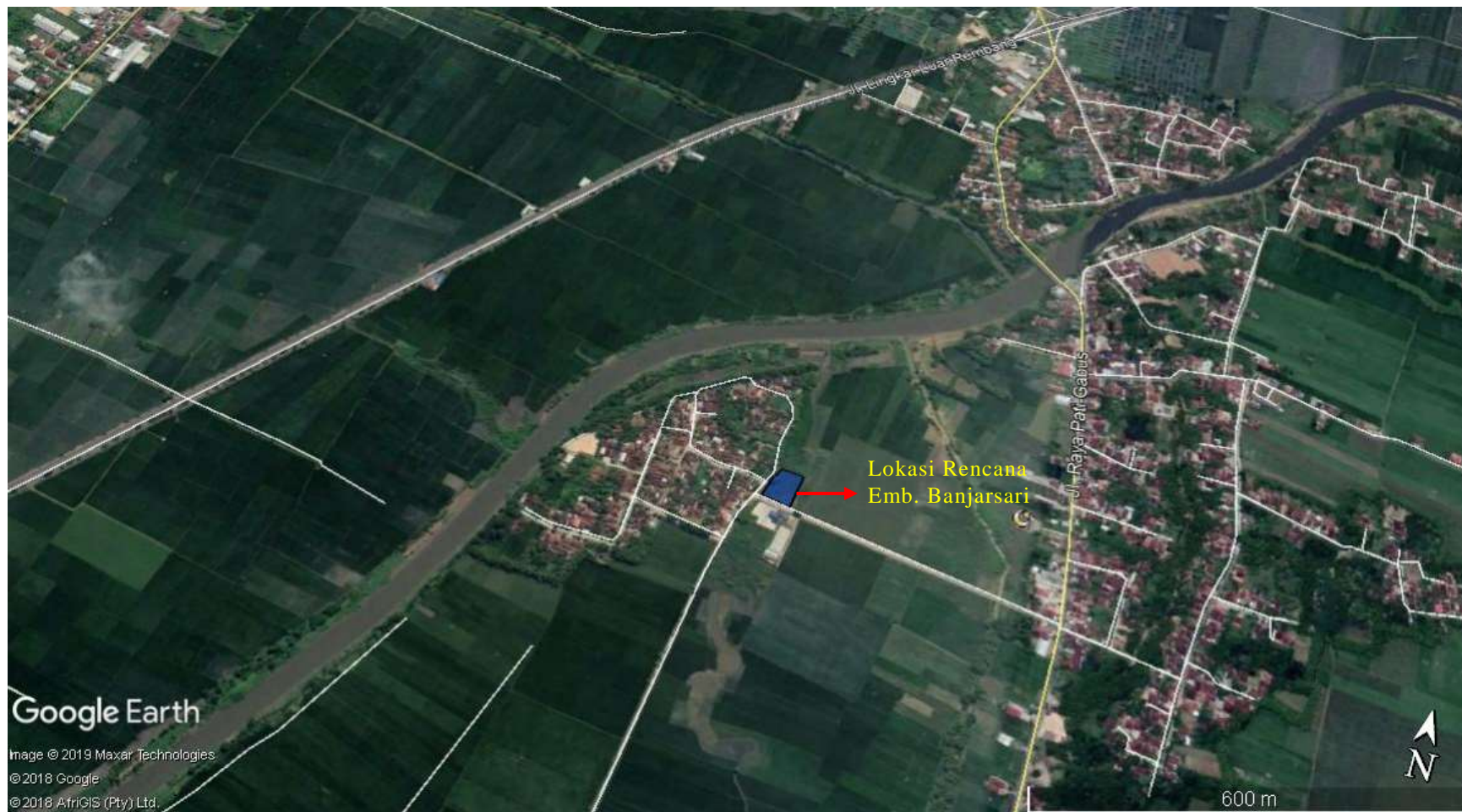
Gambar 3 Peta Lokasi Pekerjaan Embung Banjarsari di Desa Banjarsari, Gabus, Kabupaten Pati