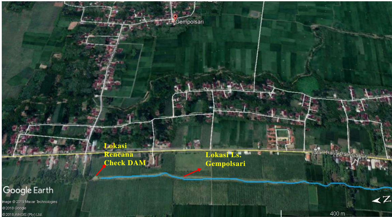
Gambar 1 Peta Lokasi Pekerjaan Ls. Gempolsari di Kabupaten Pati