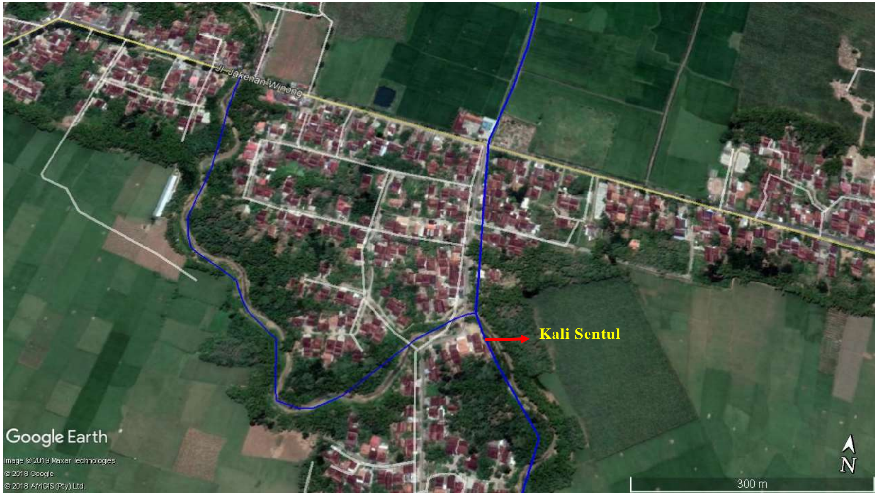
Gambar 2 Peta Lokasi Pekerjaan Ls. Sentul di Desa Sembaturagung, Kecamatan Jakenan, Kabupaten Pati