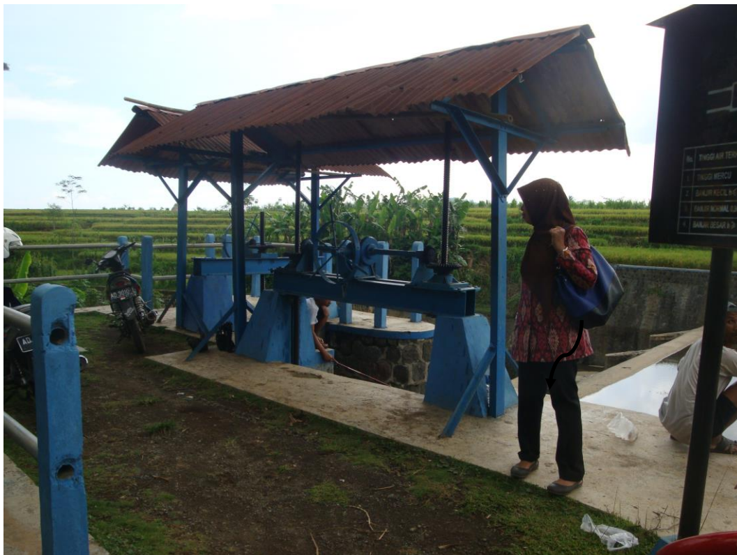
Bangunan Pengambilan Bendung Wonotoro