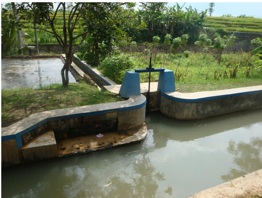
Bangunan Sadap DI Wonotoro